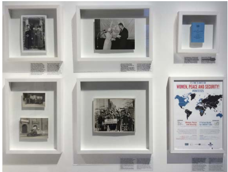
Øverste række midt. forkvinde Else Zeuten modtages i 1949 af FN's første generalsekretær Trygve Lie.